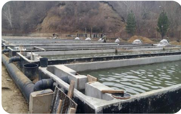
თევზის გადამამუშავებელი საწარმო