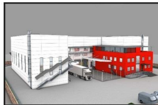
საბაჟო გამშვები პუნქტი