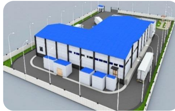
კენკროვანი კულტურის შოკური გაყინვა, სამაცივრე მეურნეობა