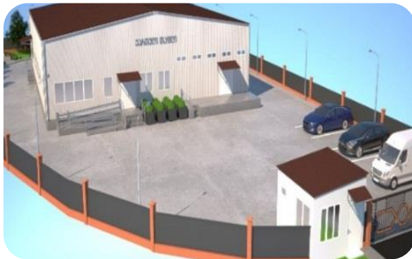
თაფლის გადამამუშავებელი საწარმო