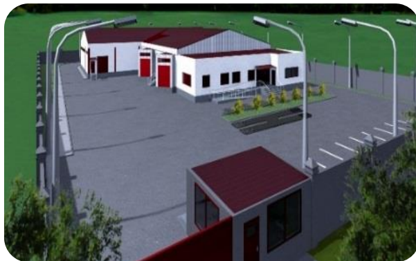
ხილ-ბოსტნეულის შესანახი მაცივარი, საკონსერვო საწარმო